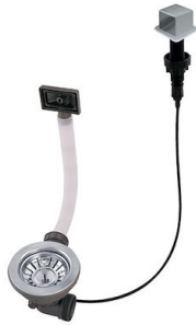
自动下水器 LIRA 8407 103